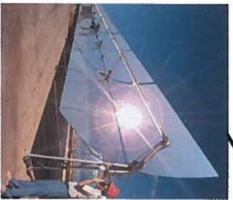
from Thermodynamic Solar