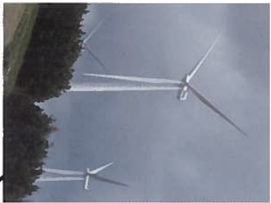
from Wind farms